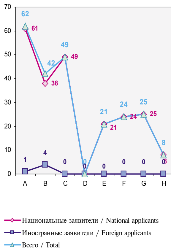
Рис. 1 / Fig. 1

For the international applications filed with the International Bureau of World Intellectual Property Organization (Geneva) according to the Procedure of Patent Cooperation Treaty (PCT) and for the Eurasian