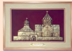
Հուշանվեր ("Եկեղեցիներ"): Դեղ.՝ Եղիշե Ներսիսյան

Մանրամասների համար, թե ինչպես կարող եք պաշտպանել Ձեր իրավունքները, խորհուրդ է տրվում դիմել մտավոր սեփականության/ՄՍ հարցերով զբաղվող իրավաբանի: