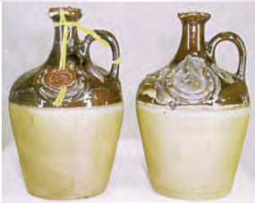
Եռաչափի նմուշի օրինակ