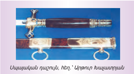
Սպայական դաշույն, հեղ.՝ Արթուր Խաչատրյան

Օգտագործումը կարող է վերաբերել, մասնավորապես, դրա պատրաստմանը, վաճառքի առաջարկությանը, վաճառքին, ներմուծմանը կամ նմուշը ներառող կամ այն մարմնավորող արտադրանքի օգտագործմանը, ինչպես նաև նման նպատակներով դրա պահեստավորմանը: Սա իմաստ է հաղորդում բիզնեսին, քանի որ բարելավում է բիզնեսի մրցունակությունը և հաճախ լրացուցիչ եկամուտ է բերում ներթոնշյալ ձևերով: