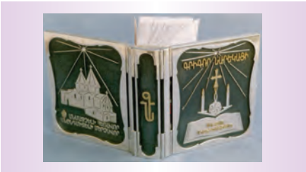
Գրքի կոշտ կազմ, հեղ.՝ Լենա Թորգոմյան

Որոշ երկրներում հեղինակային իրավունքով նմուշի պահպանությունը տարածվում է նմուշների որոշակի տեսակի վրա: