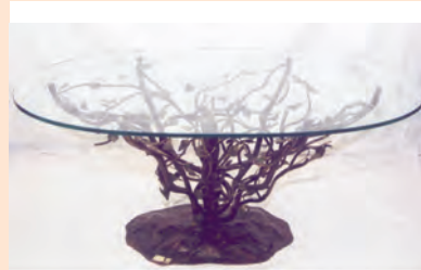
Սեղան: Յեդ,՝ խաչատուր Աղաջանյան

Չնայած տարբեր արտադրության սեղանների գործառնության բաղադրիչները զգալիորեն չեն տարբերվում միմյանցից, սակայն ամենայն հավանականությամբ դրանց արտաքին տեսքը հիմնական որոշիչ գործոնն է շուկայում հաջողություն ունենալու համար: Ահա թե ինչու շատ երկրներում արդյունաբերական նմուշների գրանցամատյաններն ունեն բավականին երկար ցուցակ այնպիսի կենցաղային ապրանքի համար, ինչպիսին սեղանն է: